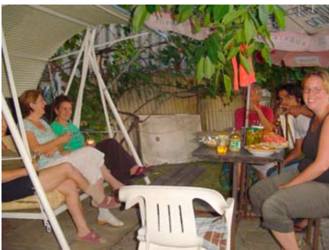
Abschiedsessen beim Nachbarn

Ich habe auch erfahren wie es ist, wenn man zuerst einander nicht versteht und zuerst gegenseitig die Kultur kennenlernen