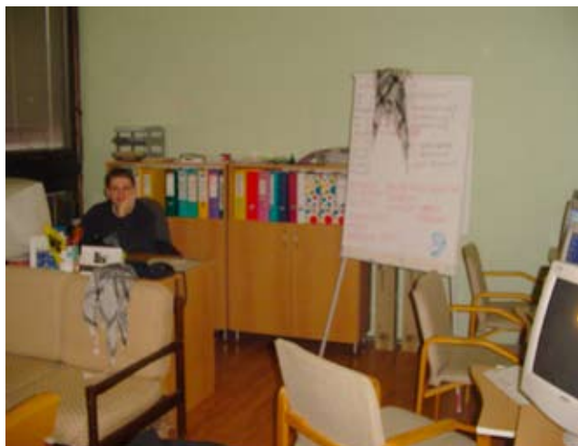
Unser Büro in der Stadt

Nach dem ich von meiner Reise, bei welcher ich von EVS erfahren habe, zurück gekommen bin, habe ich herausgefunden, dass es EVS tatsächlich auch in der Schweiz gibt. Ich habe gleich eine E-Mail verschickt. Dann ging alles sehr schnell. Ich habe ein Projekt gefunden, welches mich interessierte. Ich habe mich dort mit einem Motivations-Brief und eine CV vorgestellt und für einen Platz angefragt.