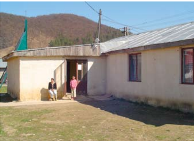
Youth- Club in Podskalkwo