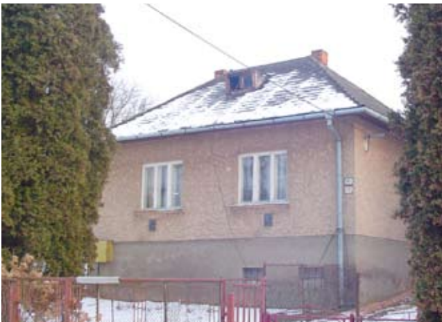
Unser Haus in Humenné