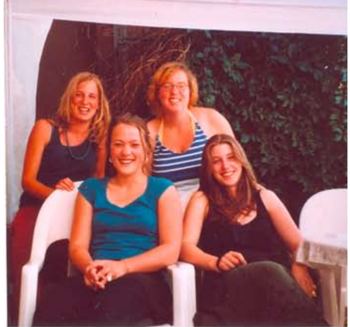
Meine neuen WG-Mitbewohnerinnen in Burgdorf

Ich bin nach Hause gekommen, wie ich gegangen bin. Da mein Bus wieder einmal nicht überall stoppen musste, bin ich wieder ungefähr drei Stunden zu früh angekommen. Nur dieses Mal habe ich den Slowakisch sprechenden Busfahrers verstanden. Ich konnte meiner Familie melden, dass schon um fünf Uhr morgens ankomme.