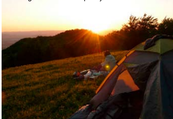
Wandern in der Mala Fatra

Nach dem On-Arrival -Training erlebte meine beste Phase. Ich hatte soo viele Ideen und liess mich auch nicht mehr von der allgemeinen Demotivation für unser Projekt mitziehen. Ich habe in dieser Zeit viel Material organisiert und einen Zeichnungs-Wettbewerb gemacht. Wir führten auch einen Tischfussball-Wettbewerb durch und ein Romas-Festival. Am Wochenende bin ich oft irgendwo hingefahren und habe andere Projekte besucht, oder ich bin mit Leuten von On-Arrival- Training in die Berge gegangen.