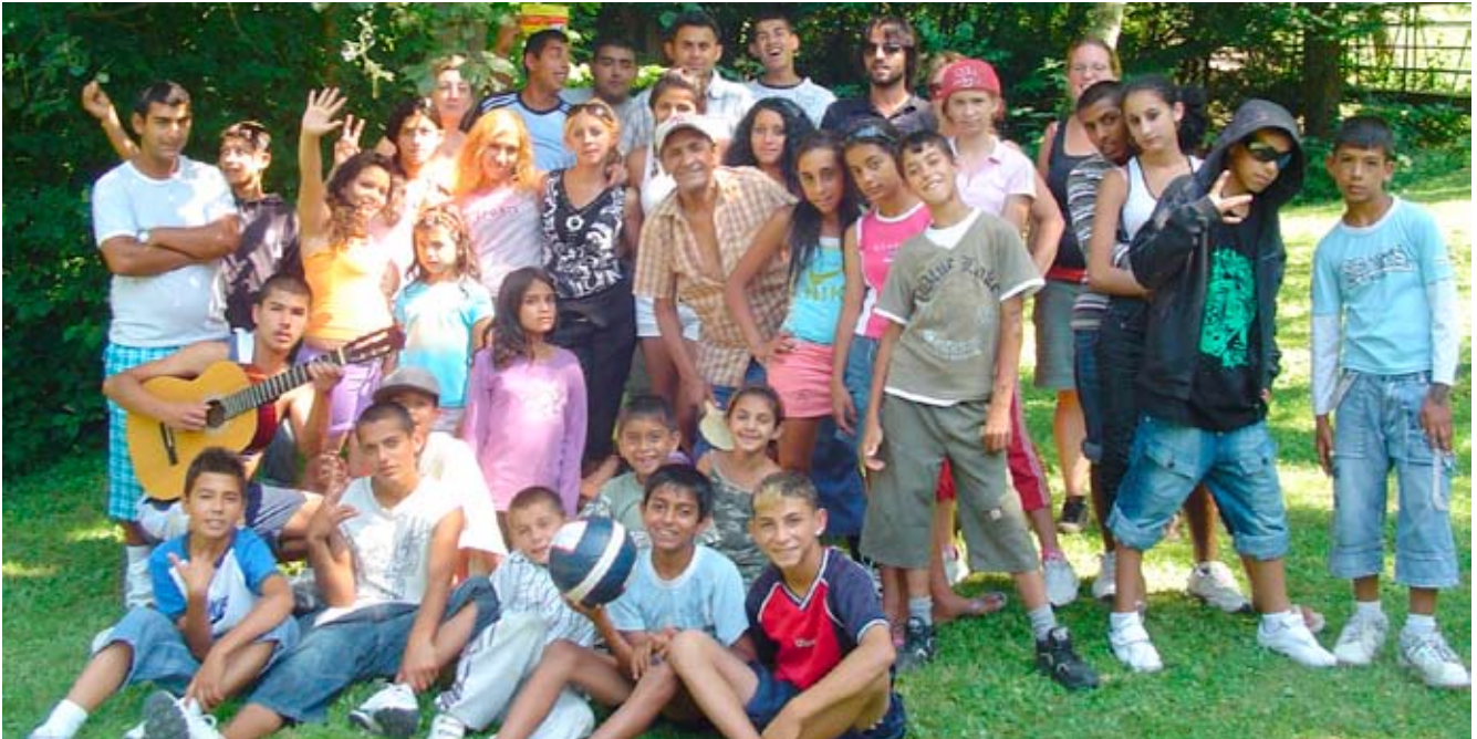
Weekend in Kamenica mit 30 Kindern und Jugendlichen